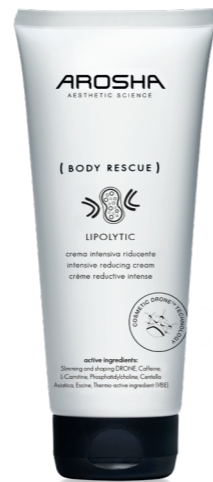
(BODY RESCUE) LIPOLYTIC CREAM 50ml

Innowacyjny system dostarczania substancji aktywnych, COSMETIC DRONE™, to WYSPECJALIZOWANA i SELEKTYWNA metoda, która zapewnia ukierunkowane i skuteczne działanie w walce z niedoskonałościami i miejscowymi złoгами tłuszczu. Skuteczność kremu gwarantuje synergia wyszczuplających składników aktywnych ze składnikiem termoaktywnym (VBE), który przyczynia się do przyspieszenia przemiany materii i poprawy mikrokrążenia. Testy kliniczne i instrumentalne wykazały zmniejszenie obwodu i objętości brzucha*. Testowany dermatologicznie.