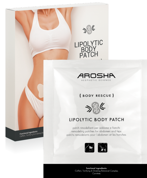
(BODY RESCUE) N. 4 LIPOLYTIC BODY PATCH 12g